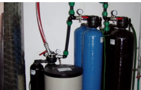
Úpravna vody (4)