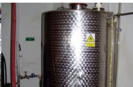
Míchací nádoba (2)