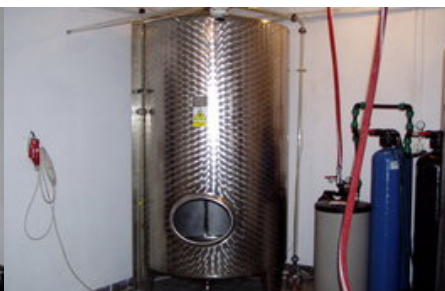
Zásobník 3000 (3)