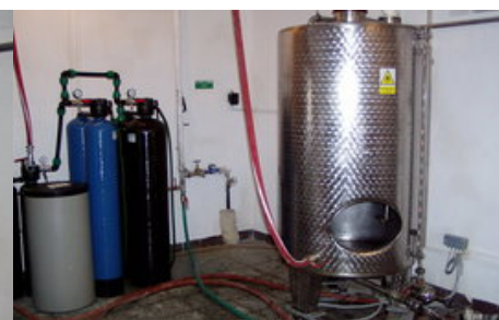
Míchací nádoba (2)