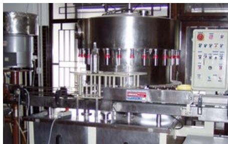
Kruhová plnička (5)